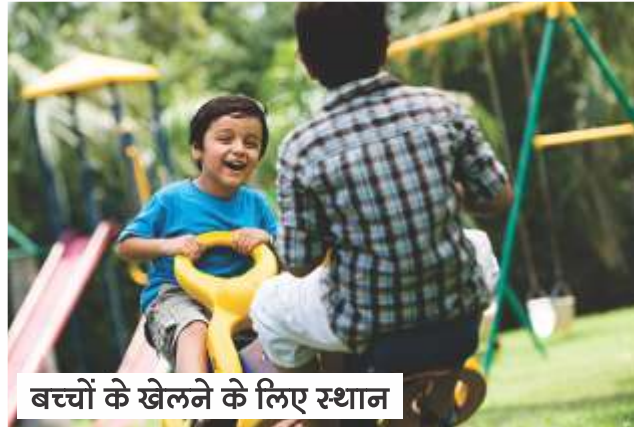
बच्चों के खेलने के लिए स्थान