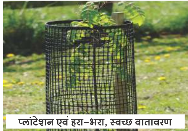
प्लांटेशन एवं हरा-भरा, स्वच्छ वातावरण